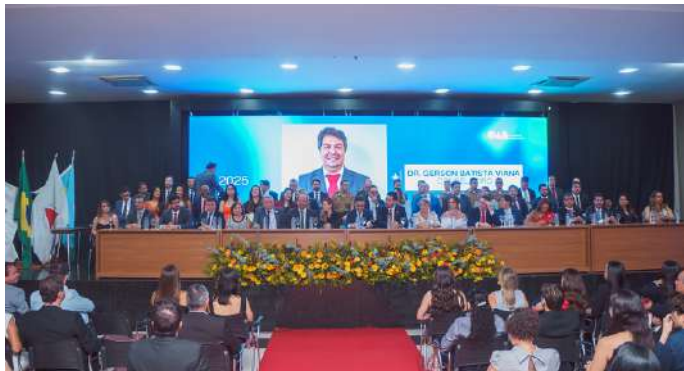
Diretoria da CAAMG na solenidade em Montes Claros, no Norte de Minas

Os diretores da Caixa de Assistência neste mês prestigiaram diversas posses de subseções para o triênio 2025/2027. Confira as fotos abaixo: