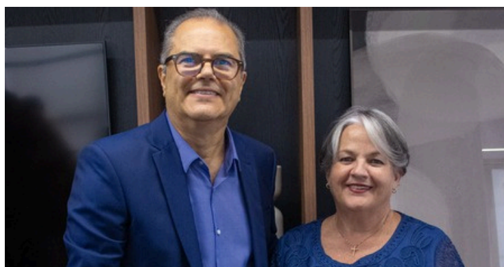
VISITA DE CORTESIA DO INSTITUTO MINEIRO DE DIREITO ADMINISTRATIVO