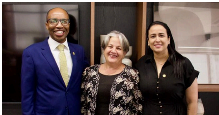
REUNIÃO ENTRE A CAAMG E A CÂMARA MUNICIPAL DE BELO HORIZONTE