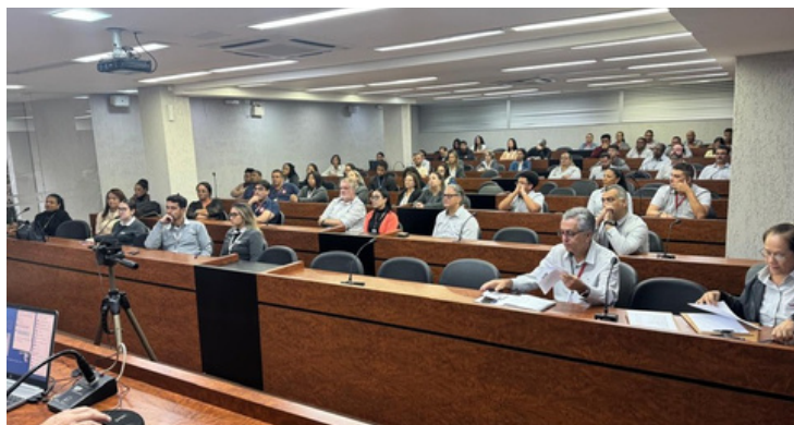
COLABORADORES PARTICIPARAM DE PALESTRA SOBRE “COMUNICAÇÃO CONSCIENTE”